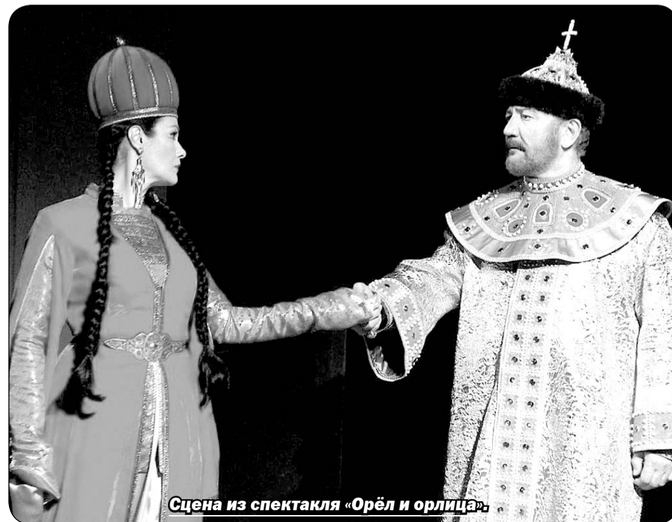
Сцена из спектакля «Орёл и орлица»

– Мне намного ближе театр, нежели кино. В кино нет той магии взаимодействия со зрителем. Тем не менее,